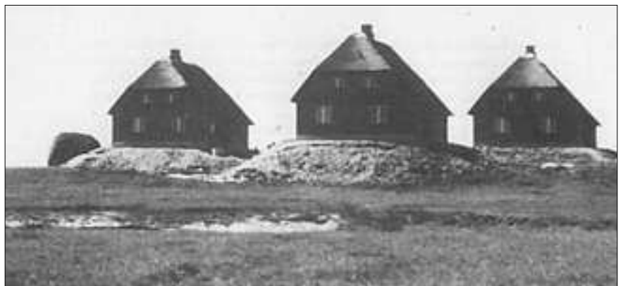
Die erhöhte und abgeflachte Westerwarft auf Hallig Hooge. (Aufn. 1954)

Der Landgewinnung und zugleich der Beruhigung der Wattenströme diente ein erster, um 1860 errichteter Lahnungsdamm zur Hamburger Hallig. Zwanzig Jahre später, 1880, wurden dann die ersten, vom preußischen Staat finanzierten Schutzmaßnahmen für die Halligen getroffen, in dem die Halligkanten mit Granit und Basaltsteinen versehen wurden, wobei das Westufer der Hamburger Hallig in den Jahren 1880 bis 1883 den Anfang machte. Als nächste Hallig erhielt Oland „im Jahre 1896 eine 820 m lange Steindecke und einen 4,6 km langen Damm zur Lütjenswarft in Fahretoft“, wie Riecken in „Die Halligen