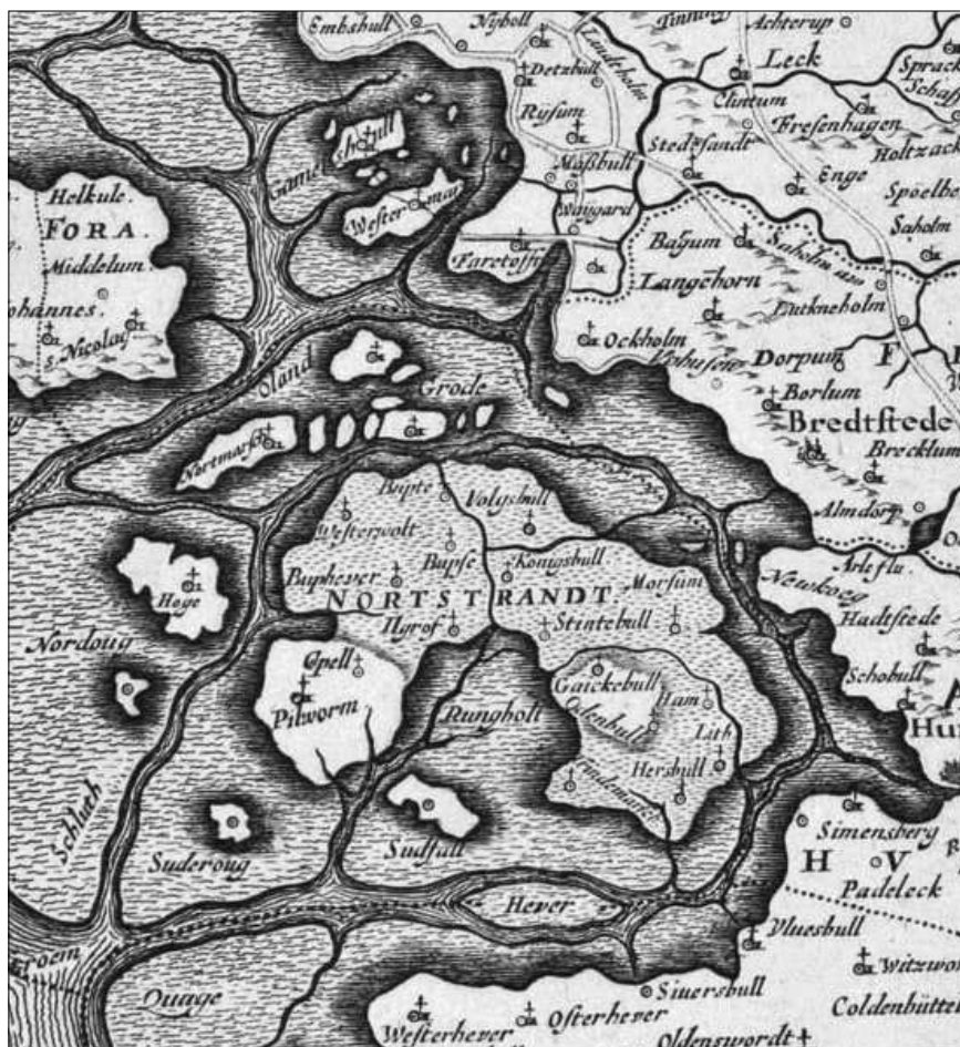
Das Gebiet der Halligen um 1650 auf einer Karte von Johannes Mejer.

Die Landfläche der gesamten Halligen wurde von den Halligvorstehern selbst vermessen und an die Regierung gemeldet. Nach dieser gemeldeten Halligfläche wurden dann die Steuern berechnet. Die gemeldeten Flächen schienen der Obrigkeit aber wesentlich zu gering und es wurde im Jahre 1789 eine amtliche Vermessung auf Kosten der Halligbewohner angeordnet, die Halligleute erhoben gegen diese Maßnahme Einspruch und hatten damit vorerst auch Erfolg. Zehn Jahre später, 1799, dann die erneute Ankündigung der Regierung zur Landvermessung und erneut legten die Halligbewohner Einspruch ein,