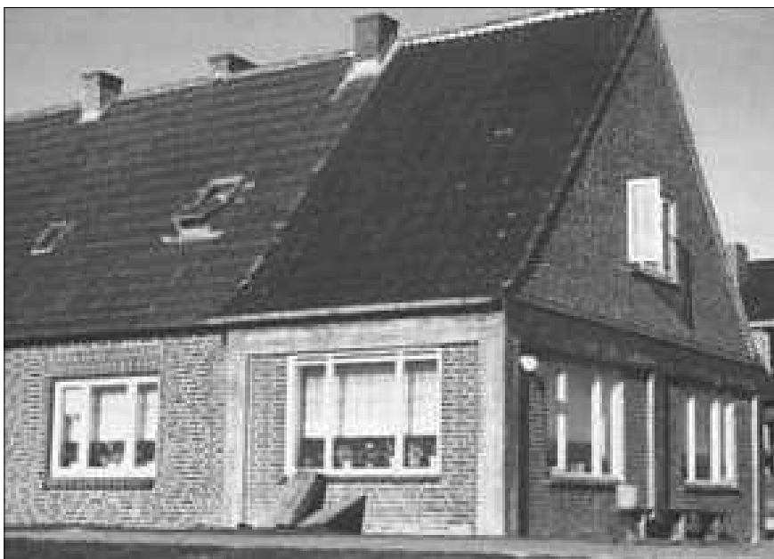
Sollte das übrige Gebäude bei einer Sturmflut auch völlig zerstört werden, so bietet der deutlich erkennbare Fluchraum mit seinen 4 m tief in den Warftboden reichenden Pfeilern große Sicherheit.

Zum Schutz vor Überflutung stehen die Halliggebäude auf künstlich