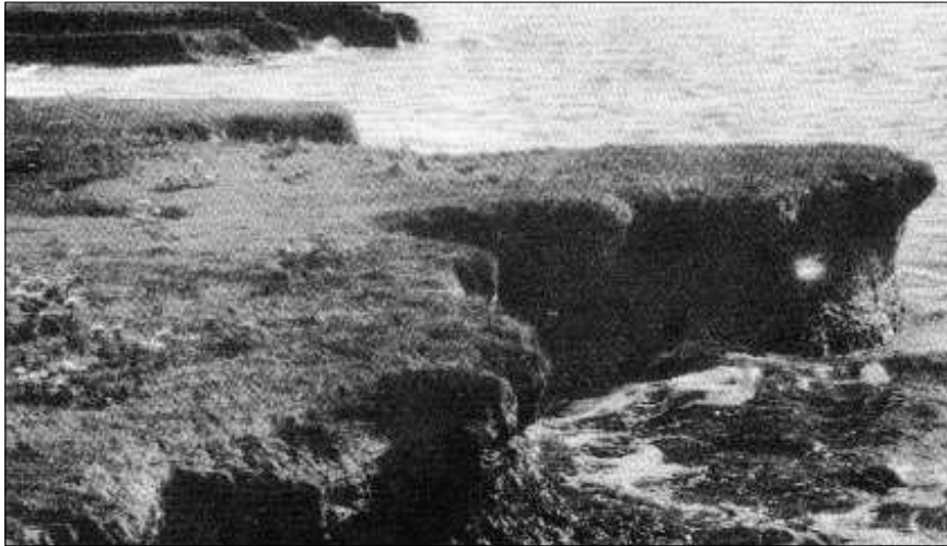
Abbruch-Ufer auf der Hallig Hooge, um 1910.

Landschreiber Bahnsen berichtete am 19. Februar 1825: „Auf sämtlichen Halligen sind nur 21 Häuser (von insgesamt 339) in so weit von den Wellen verschont geblieben, daß selbige bewohnt werden können. Alle übrigen Wohnungen sind theils ganz zusammen gestürzt, theils zur Hälfte eingerissen, theils gar nur noch einige Fächer davon übrig geblieben.“ Die Kirchen von Nordmarsch-Langeneß und Gröde wurden völlig zerstört. 234 Menschen verließen ihre Hallig nach dieser Flut, viele von ihnen für immer.