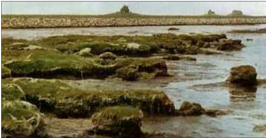
Hallig Nordstrandischmoor mit der letzten Abbruchkante. Die Steinböschung als Ufersicherung ist deutlich zu erkennen. (Aufn. 1968)

im Wandel“ schreibt. Das Westufer von Oland wurde 1896 ebenso mit einem „Steindeich“ gesichert und der Verbindungsdamm zwischen Oland und Langeneß wurde 1899 fertiggestellt. In den Jahren 1899-1902 befestigte man das Westufer von Gröde und von 1901-1904 das Westufer von Nordmarsch mit Granit und Basaltsteinen, 1911-1915 wurde Hooge fast vollständig in gleicher Weise gesichert. In den zwanziger und zu Beginn der dreißiger Jahre des vorigen Jahrhunderts wurden die letzten Halligen ebenfalls mit einer fast vollständig umschließenden Steindecke versehen. Ab den 1930er Jahren ist der Bestand der Halligen als gesichert anzusehen.