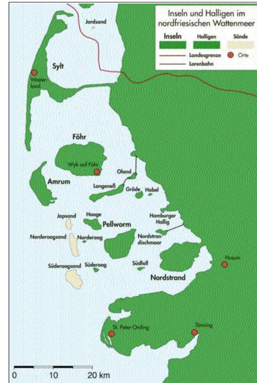
Lage der Inseln und Halligen im Nordfriesischen Wattenmeer im Jahre 2006.

Höhe. Die genaue Anzahl der seit der 2. Hälfte des 16. Jahrhunderts bis heute verschwundenen Halligen ist nicht genau geklärt. Die Karten aus der Zeit lassen viele Eilande unbenannt und insbesondere auch durch die Sturmflut im Jahre 1634 sind manche Gebiete von größeren Inseln gelöst worden oder später ganz verschwunden. Friedrich Müller führt in seinem Werk „Das Wasserwesen an der schleswig-holsteinischen Nordseeküste“, 1917, Band I, 29 Halligen namentlich auf und schreibt, „daß man nicht fehl gehen wird, wenn man mindestens etwa 50 ehemalige Landteile des alten Nordfriesland annimmt, die den Halligcharakter besaßen“. Heute gibt es noch zehn Halligen im nordfriesischen Wattenmeer, wenn