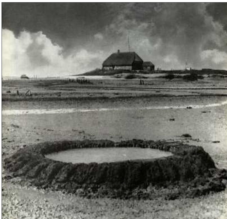
Sodring (Rest einer Zisterne) der untergegangenen Süderwarf der Hallig Habel, dahinter die heutige Hallig Habel. Sie ist mit 3,6 ha die kleinste Hallig im nordfriesischen Wattenmeer.